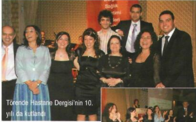
Törende Hastane Dergisi'nin 10. yılı da kutlandı

mek bizleri çok duygulandırdı. Barkovizyon gösterisi bittiğinde konukların coşukluğu alkışları onların da en az bizler kadar duygulandığının göstergesiydi. Bu duygulu anları 10. yıl pastamızı keserek pekiştirdik.