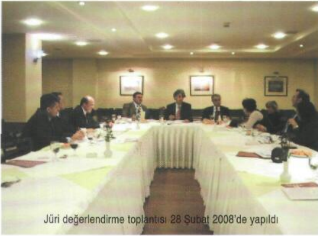
Jüri değerlendirme toplantısı 28 Şubat 2008'de yapıldı

"Hastane Dergisi Sağlık Yönetimi Ödülleri" sağlık sektörünün gelişiminde sağlık çalışanlarının bireysel çabalarının taşıdığı önemden hareketle, kendi alanında gösterdiği başarılı uygulamalarıyla dikkat çeken sağlık yöneticilerinin