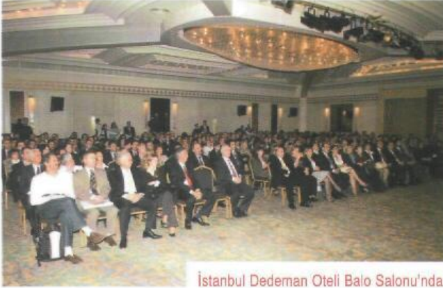
İstanbul Dedeman Oteli Balo Salonu'nda yapılan ödül töreni 250 kişi tarafından izlendi.